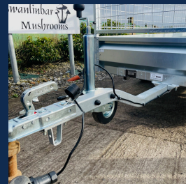
Timon col de cygne pour un meilleur rayon de braquage