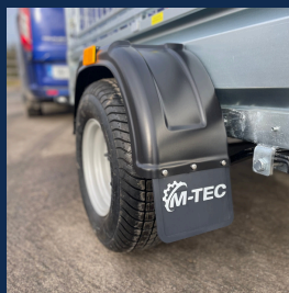
Pneus tout terrain