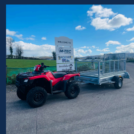
Double usage : Le quad peut remorquer ou être remorqué !