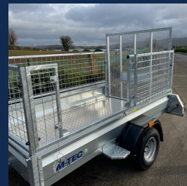
Porte latérale et marche-pied pour faciliter l'accès