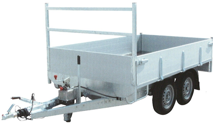
1500 kg avec pompe manuel