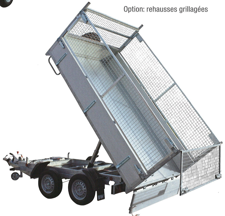
Option: rehausses grillagées