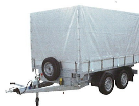
Option: bâche haute