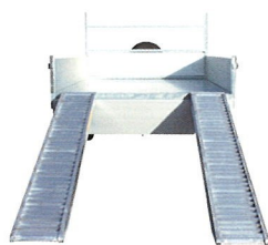
Option: rampes avec logement sous le plateau