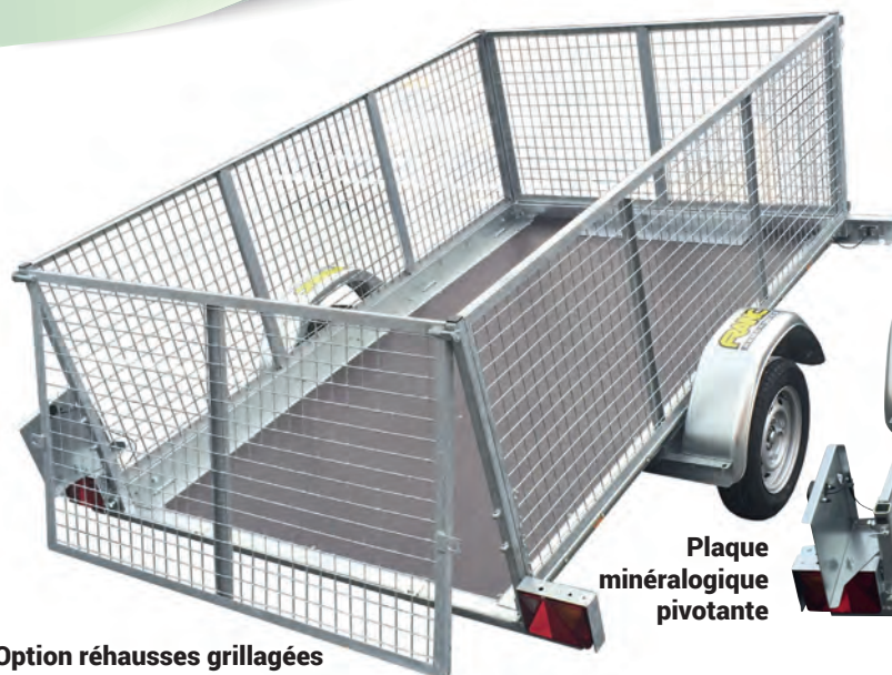
Option réhausses grillagées

Pour toutes remorques fabriquées depuis le 29/01/2012, la remise du COC* est obligatoire par le distributeur. *Certificate Of Conformity