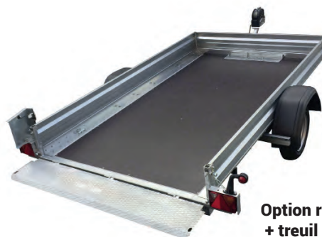
Option ridelle acier + treuil + rampe