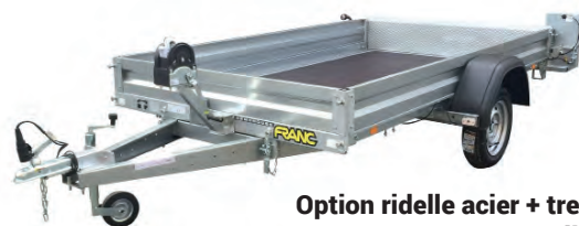
Option ridelle acier + treuil + rampe + support treuil