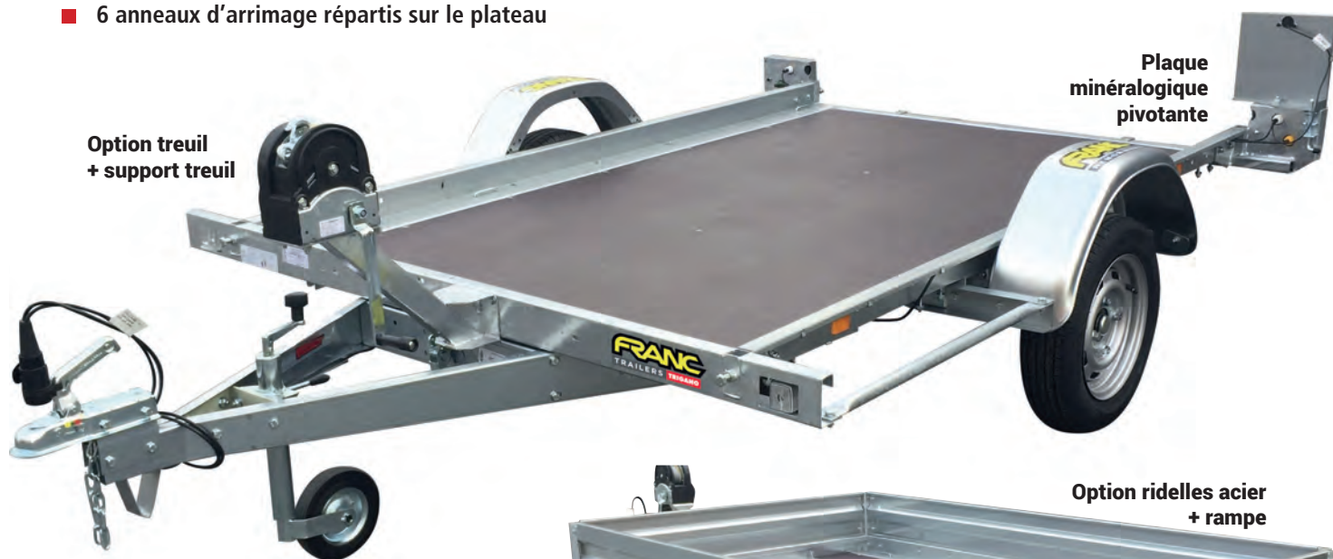
Option treuil + support treuil