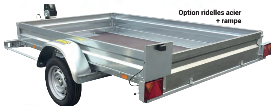
Option ridelles acier + rampe

Pour toutes remorques fabriquées depuis le 29/01/2012, la remise du COC* est obligatoire par le distributeur. *Certificate Of Conformity