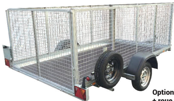
Option ridelles grillagées + roue de secours