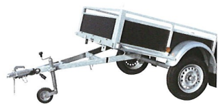
Option: timon basculante