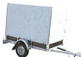
Option: bâche haute