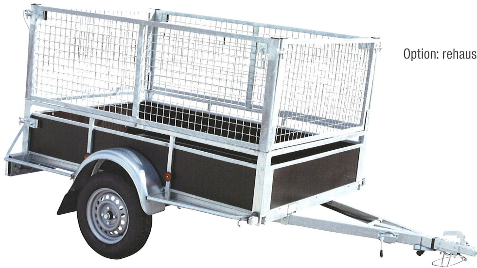
Option: rehausses grillagées