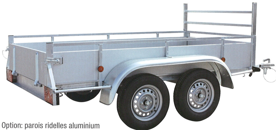
Option: parois ridelles aluminium