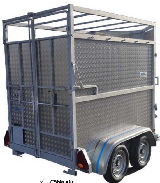
✓ Côtés alu (option)