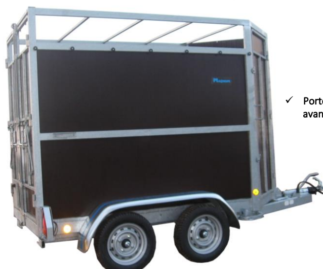
✓ Porte avant