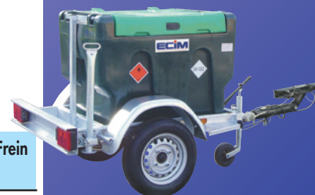
DG ADR 1400 AF