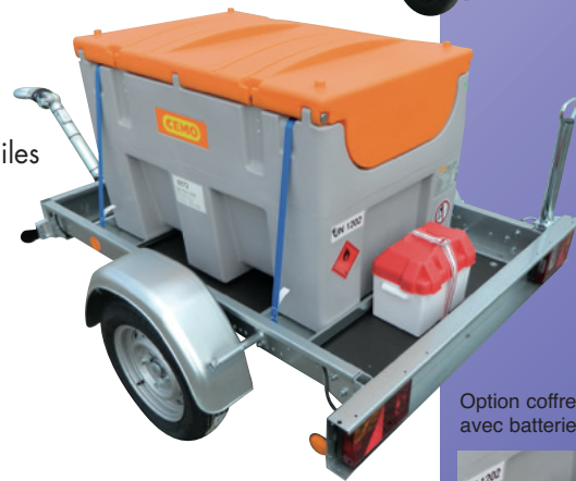
Option coffre avec batterie d'alimentation