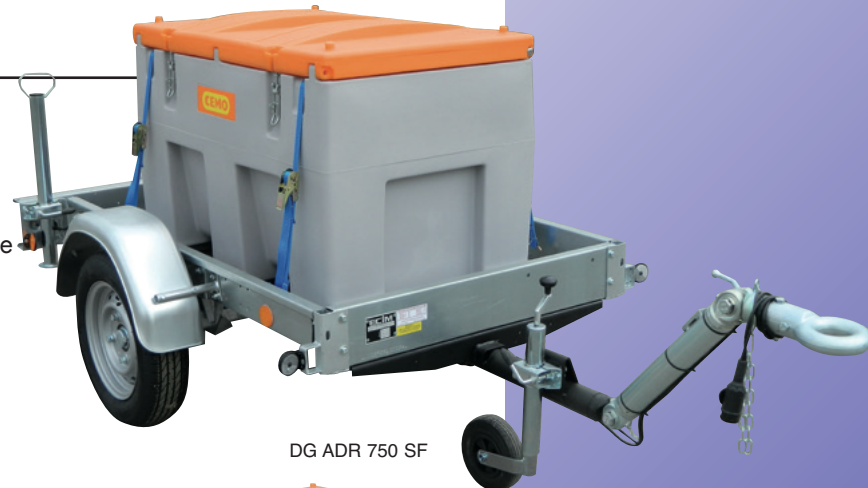
DG ADR 750 SF