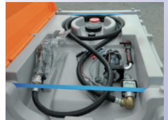
Réservoir de 430 L