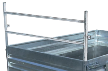
Porte échelle avant