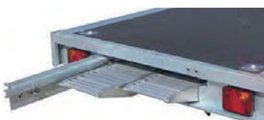
Rampes aluminium L 2,40 m