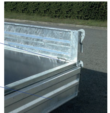
Ridelle arrière basculement par le bas