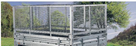
Réhausse grillagée - H 80 cm