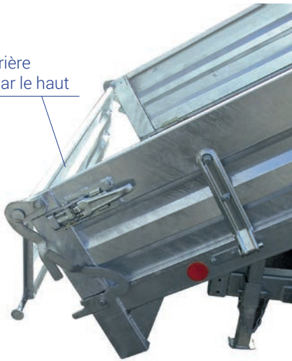
Ridelle arrière basculement par le haut