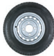
Roue de secours