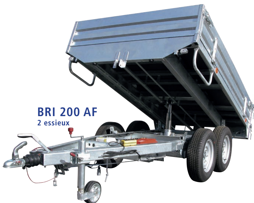
BRI 200 AF 2 essieux