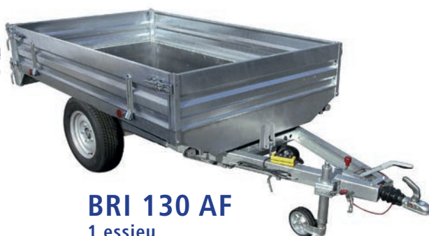
BRI 130 AF 1 essieu

Pour toutes remorques fabriquées depuis le 29/01/2012, la remise du COC* est obligatoire par le distributeur. *Certificate Of Conformity