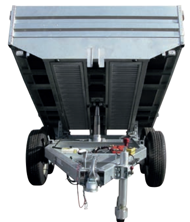
Option rampes de montée logées sous la benne