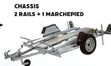
CHASSIS 2 RAILS + 1 MARCHEPIED