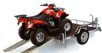
CHASSIS PLATEAU BOIS 2 RAMPES + BÉQUILLES STABILISANTES