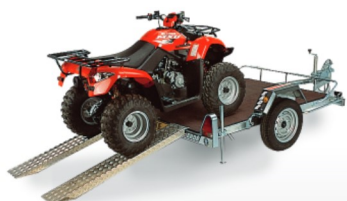
CHASSIS PLATEAU BOIS 2 RAMPES + BÉQUILLES STABILISANTES