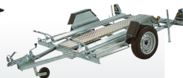
CHASSIS 2 RAILS + 1 MARCHEPIED